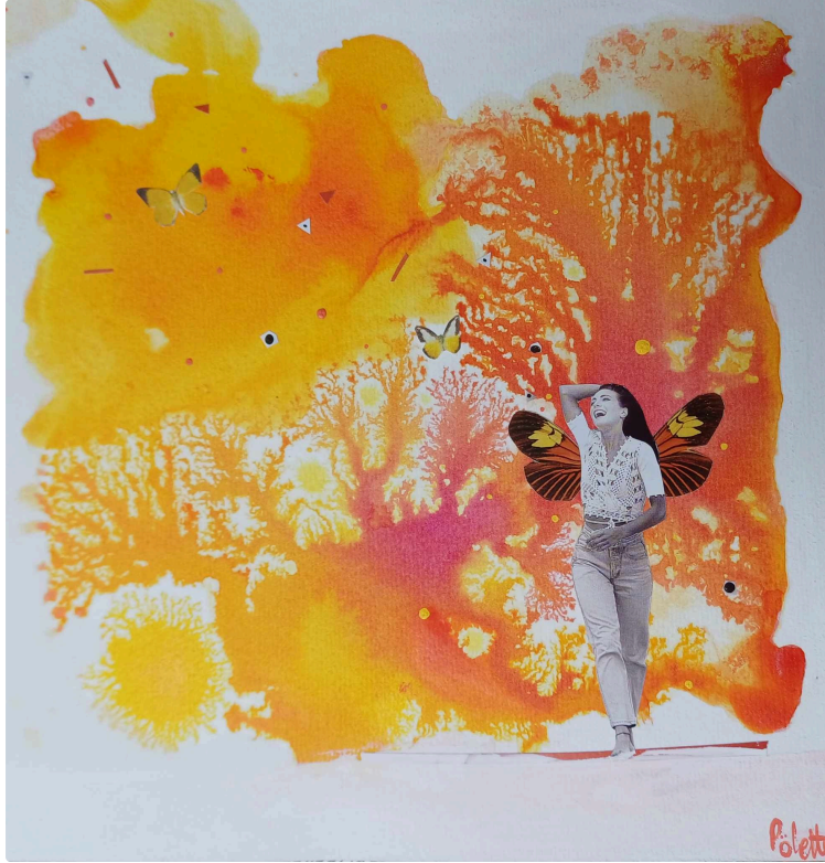
Exposition Délires, une exposition contre la morosité ambiante !

Pour lutter contre la morosité ambiante, venez rêver et sourire en dégustant les pépites d'humour noir et de rêve que vous propose l'exposition justement nommée "Délires"