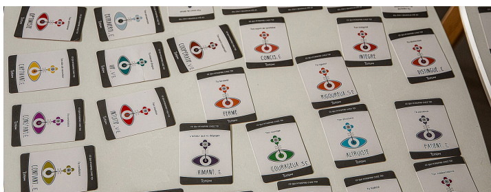
Les cartes indiquant chacune une qualité sont disposées sur 2 petites tables

Au début, chacun doit choisir une carte où figure une qualité qu'il estime avoir (ferme, aimant, intuitif, altruiste etc.), ce qui montre déjà les différences.