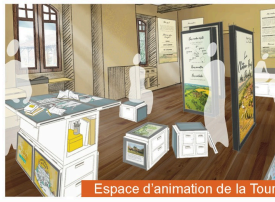
Espace d'animation de la Tour