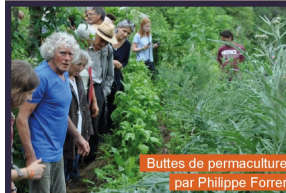
Buttes de permaculture par Philippe Forrer