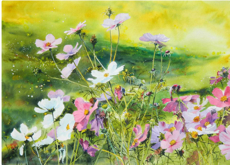
Festival Odysée : de la musique mais aussi des expositions !

Dans deux précédents articles, nous vous avons parlé des deux têtes d'affiche de la soirée concerts du festival Odysée d'Africa Vic, le groupe Graines de Sel et René Lacaille :