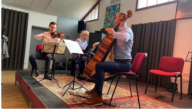
Les Musicales des Coteaux de Gimone célèbrent leur 20e anniversaire en 2024

L'année 2024 marque un jalon important pour les Musicales des coteaux de Gimone, pour leur 20e anniversaire.