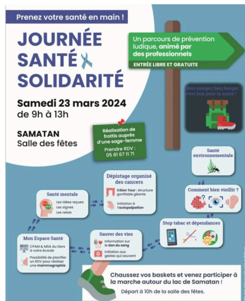
samatan sante 321.JPG