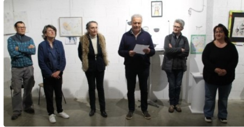
Expos éphémères de l'Atelier des Berges du Gers

Jeudi après midi avait lieu le premier vernissage de l'expo des œuvres des élèves de l'artiste peintre Marie-Pascale Lerda dont l'enseignement s'adresse à la fois aux débutants comme aux artistes confirmés, aussi bien dans ses cours hebdomadaires de dessin peinture, de modèle vivant ou d'aquarelle que lors de ses stages multitechniques.