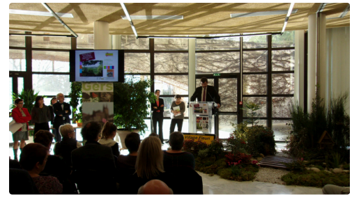
A la tribune, Christian Touhé-Rumeau, président de la fédération des offices de tourisme de Midi-Pyrénées.