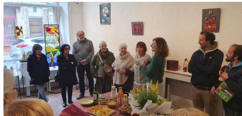
gimont expo mars.jpg