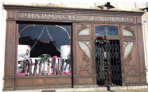
La mythique pharmacie Pérès