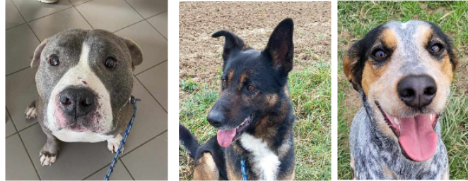
Trois nouveaux venus, trois véritables "nounours" dont une adoption SOS !

Cette semaine, la SPA vous présente trois nouveaux venus qui ont en commun d'être trois boules d'amour.