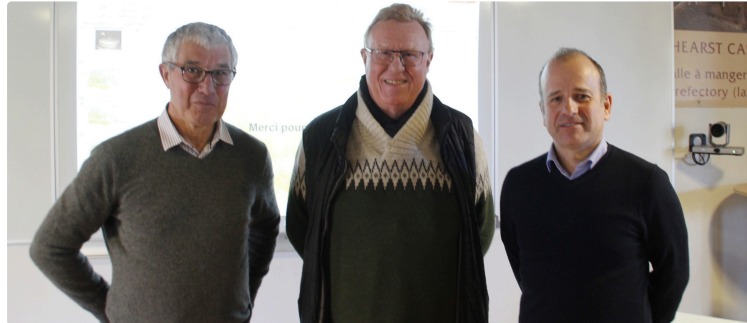
Sur les traces des moulins de Pardiac Rivière Basse