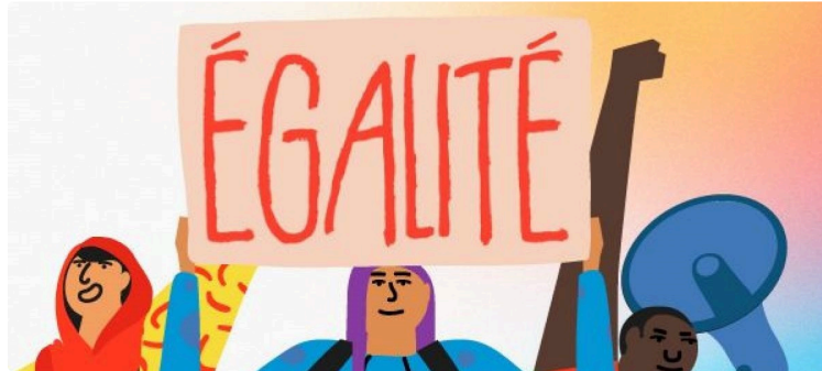
8 Mars 2024 Journée internationale des femmes

La Journée internationale des femmes, selon la terminologie de l'ONU, célèbre les efforts considérables déployés pour les femmes et les filles partout dans le monde pour façonner un futur plus égalitaire. C'est l'occasion de mobiliser en faveur des droits des femmes, de leurs luttes, et de leur participation à la vie politique et économique. Officialisée en 1977 par l'Organisation des Nations Unies, cette journée de sensibilisation est parfois détournée de son objectif d'égalité hommes-femmes, par des opérations commerciales à la connotation fortement sexiste.