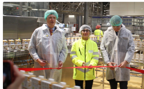
Danone 12022024 (21).JPG

Danone a réussi à développer un nouveau modèle de production et de nouvelles compétences pour s'adapter aux attentes des consommateurs, tout en optimisant ses sites de fabrication de produits laitiers.