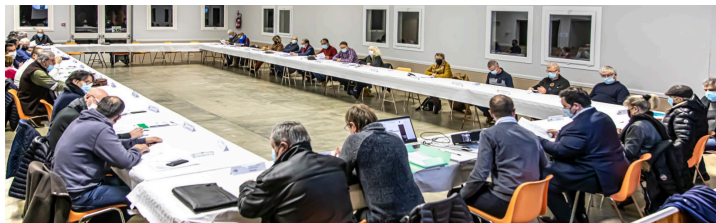
Le conseil de la CCBA en 2021 à Luppé-Violles