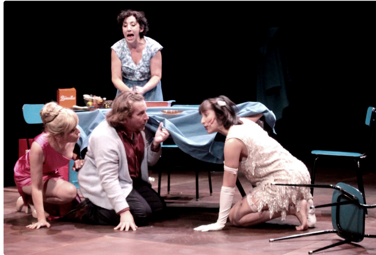
Moi aussi je suis Catherine Deneuve