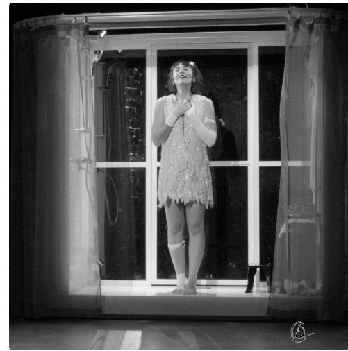
fille douche 2NB.jpg