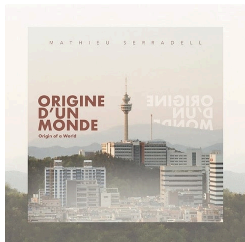
origine du monde .jpg