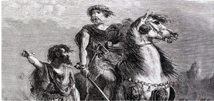
La tombe de chef de Pauilhac.