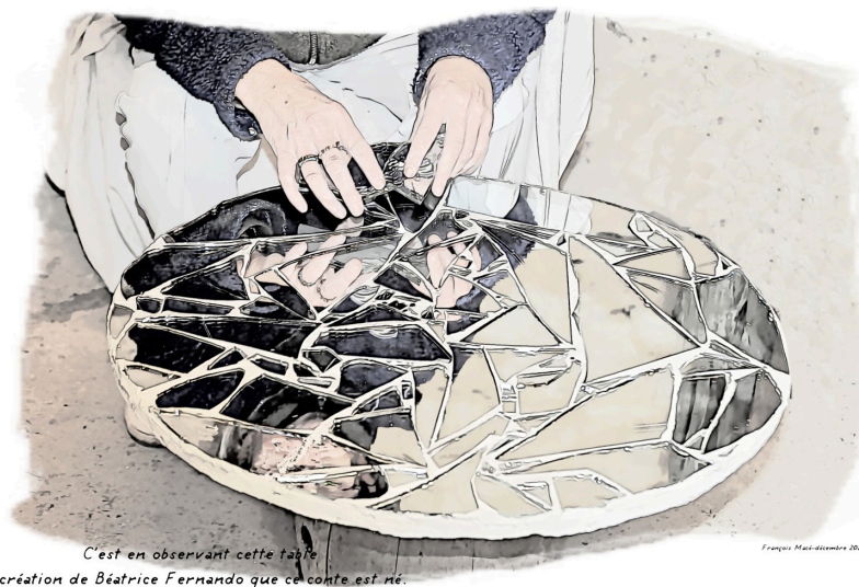
C'est en observant cette table création de Béatrice Fernando que ce conte est né.

Pour ne pas les perdre, cette dernière les colle sur le dessus d'une petite table.