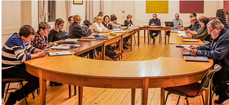
La Flamme olympique passera par Nogaro et autres infos