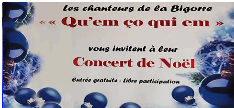
Amis de l'orgue et de la musique,

Deux bonnes nouvelles reprise des cours et concert de Noël