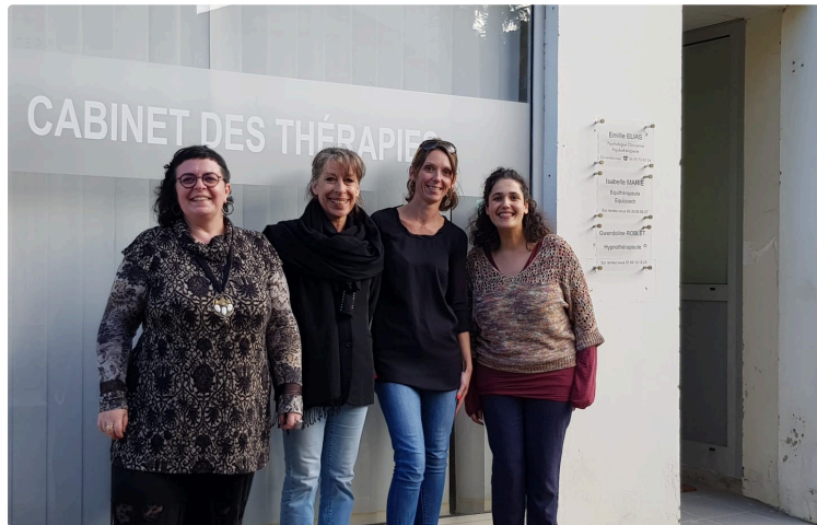
Cabinet des Thérapies de Vic Fezensac : rencontre professionnelle « Au service de la ruralité »

Après un an de fonctionnement, le Cabinet des Thérapies qui regroupe des professionnelles de l'accompagnement thérapeutique, 6 rue La Fayette, à Vic Fezensac, avait choisi le samedi 25 novembre pour convier leurs collègues du territoire.