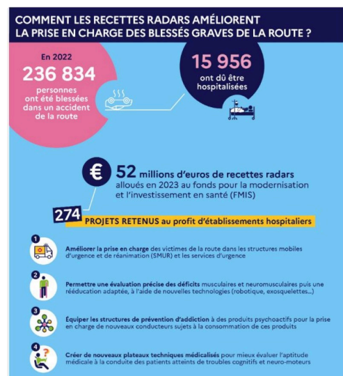
prevention routiere affiche radars.JPG

Prise en charge des blessés graves de la route : 52 millions d'euros de recettes radars alloués au fonds pour la modernisation et l'investissement en santé