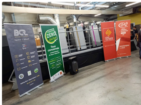
Tout est prêt pour inaugurer la presse OFFSET XL 106 4 + VERNIS.

Après les remerciements à tous les principaux partenaires et des félicitations à Perrine Crochet de la CMA du Gers « qui a beaucoup œuvrée pour l'organisation de la journée », les gérants de BCR concluront : « BCR c'est aujourd'hui 33 années d'existence, 20 collaborateurs, 800 tonnes de papier transformé et 4,3 M de CA. Une organisation qui nous permet de produire en 3x8 et de couvrir la plage horaire journalière pour les enlèvement/livraisons ainsi que l'accueil phoning et le traitement des fichiers et BAT de 7 h à 20 heures non STOP. Maintenir un haut niveau de Qualité, réactivité, service, est notre objectif principal ».