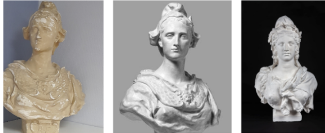
La présence de Marianne dans le patrimoine vicois