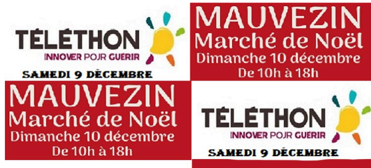
Samedi 9 décembre « Téléthon » et dimanche 10 « Marché de Noël »