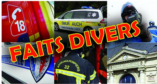
Feu d'appartement le pire évité

Lundi soir vers 18h les sapeurs-pompiers de Montesquieu Mirande, Miélan, l'Île de Noé et Vic-Fezensac ont été engagés sur un départ de feu sur la commune de Montesquieu rue Nationale. Le feu a pris dans la salle de bain d'un appartement et s'est propagé dans une chambre et dans les combles, mais a pu être contenu dans ces espaces grâce à l'intervention rapide des secours. Deux personnes, deux hommes de 67 et 59 ans, incommodés par les fumées ont reçu des soins sur place. 16 sapeurs-pompiers ont été engagés dans cette action avec deux engins feu, un camion échelle, une ambulance, et un véhicule de commandement. Sur place la gendarmerie, enedis et le maire Etienne Verret