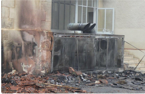
point de départ du sinistre