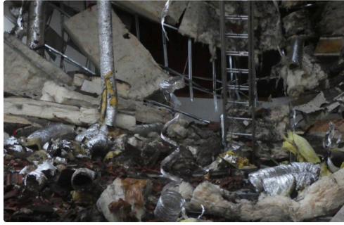
le feu a fait des ravages