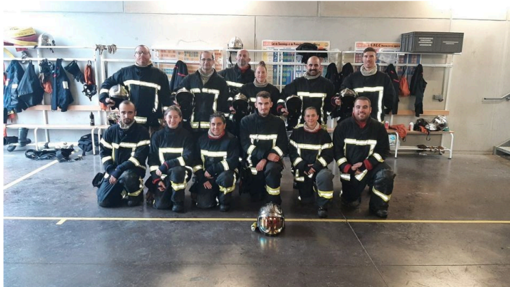
SDIS 32 : formation incendie au centre de secours

Du 21 octobre au 4 novembre, 11 stagiaires des centres d'incendies et secours de Gimont, Gondrin, Le Houga, Lombez, Mirande, Pavie et Simorre ont participé à une formation incendie qui s'est déroulée au centre de secours de Vic-Fezensac.