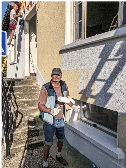
Peinture de la façade

Ces travaux, bien plus conséquents pour notre petite commune de 119 habitants, ne se feront qu'après les demandes de subventions aux autorités qui seront sollicitées pour nous aider financièrement. »