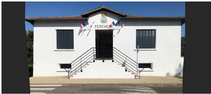
La façade de la mairie après les travaux

Merci au conseil municipal qui s'est retroussé les manches, ainsi qu'aux bénévoles de la commune qui ont également donné de leur temps libre au service du bien commun. Je les remercie vivement !