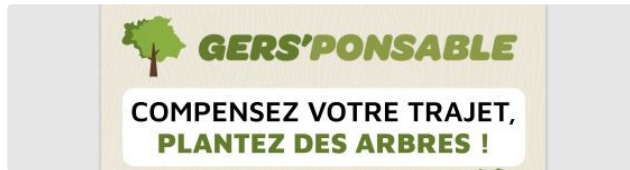
Gers'ponsable, la compensation carbone locale 100% Gers

Le nouveau dispositif de compensation carbone du tourisme qui contribue à la préservation des paysages gersois et de sa biodiversité.