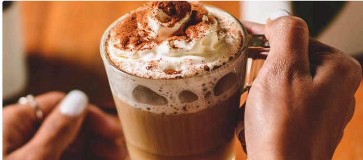
Vic Accueil : des nouveautés en novembre !

Au mois de novembre, le centre social Vic Accueil vous propose un programme riche et varié.