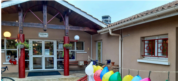
Exposition exceptionnelle «Paroles d'hier et de deux mains» à l'Ehpad du Houga