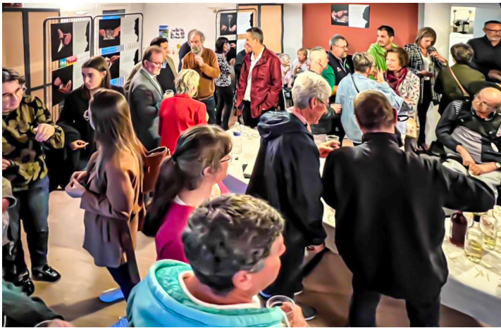
Vernissage de l'exposition

L'Ehpad Les Magnolias au Houga présente, depuis le 10 octobre 2023, une exposition exceptionnelle à tous points de vue : par le sujet, sa réalisation et sa présentation, juste, sobre et pleine de sens.