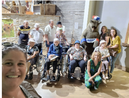
Hôpital : quand les résidents de l'EHPAD partent en vacances...

Chaque année, une dizaine de résidents de l'EHPAD de l'hôpital de Vic-Fezensac partent en vacances quelques jours en compagnie de résidents de l'EHPAD d'Eauze.