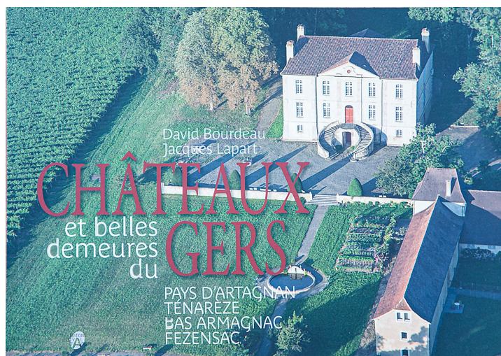
Couverture du tome 1 de l'ouvrage présenté (réédité) avec la photo du château de Viella

La chartreuse est une grande maison à simple rez-de-chaussée sur cave, composée d'un long bâtiment central symétrique, encadré ou non par deux pavillons en avant-corps (Wikipedia).