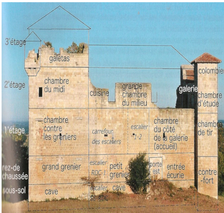
Dessin interprétatif de la distribution des pièces dans le château de Lagardère (projeté par le conférencier)

Puis au XIIe XIIIe siècle, on construit de véritables châteaux-forts en pierre, ou parfois en briques, ce qui est moins cher. Comme le château d'Espas et celui de Bascous. Et comme auparavant dans les tours "salles", les pièces d'habitation se trouvent au 2e et/ou au 3e étage.