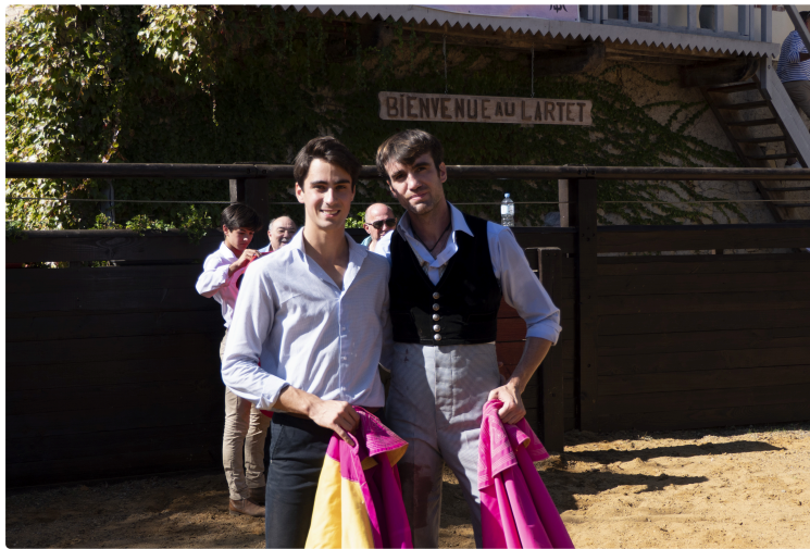
Une belle fin de temporada au Lartet

Ce samedi 7 octobre, plus de 180 personnes ont participé à la fête du Lartet qui signe la fin de la temporada 2023.