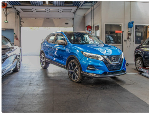
Le Qashqai entre dans les ateliers