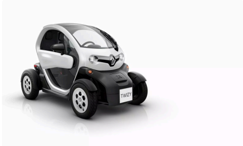
Voiturette Twizy