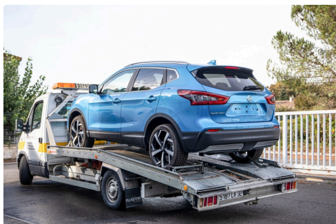
Arrivée du Qashqai