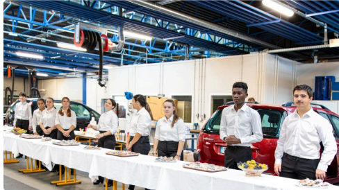
Le pot final est prêt