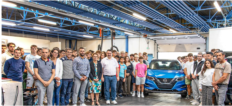
Nissan fait don d'un Qashqai à la section professionnelle du lycée de Nogaro

L'auteur du don est un ancien élève de cette section, concessionnaire à Auch