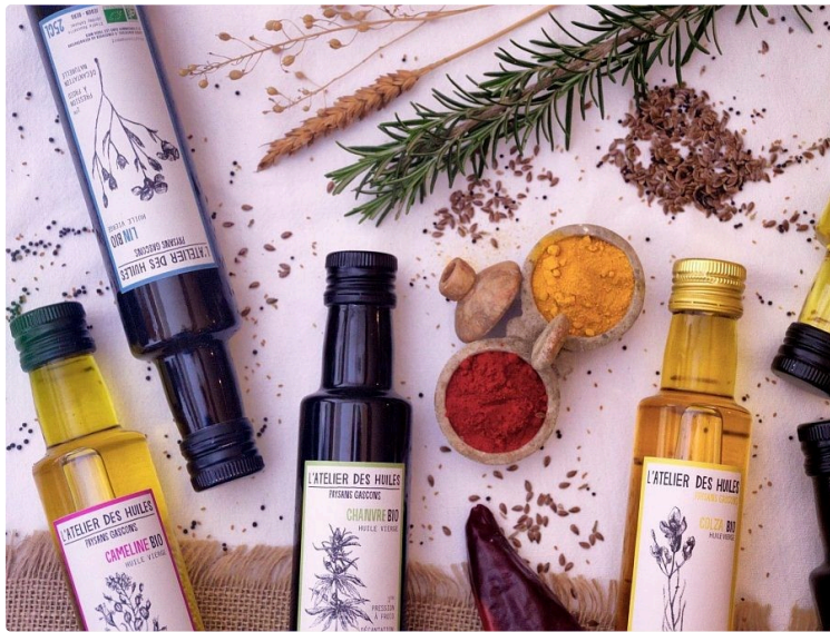
Que faire à Auch ce week-end ?

En ce dernier week-end du mois de septembre, différentes animations culturelles sont proposées dans le Grand Auch Coeur de Gascogne.