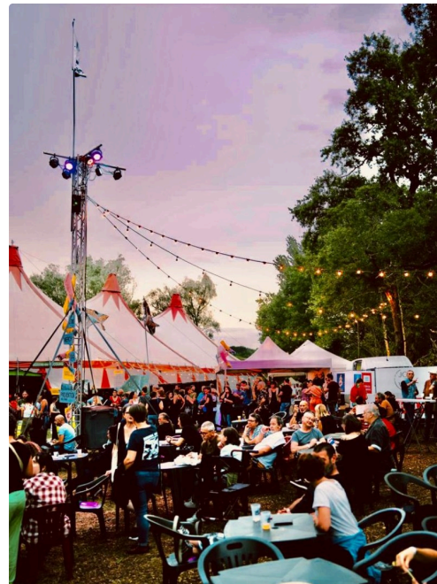
A l'extérieur du chapiteau les spectateurs flânent et se restaurent