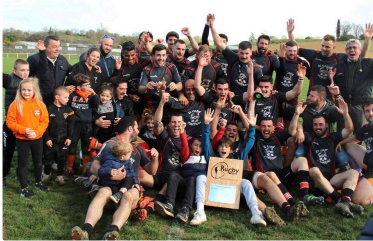
Rugbitalia : UAV Rugby, des prairies champêtres au stade de Goulin...

Dans le cadre de la coupe du monde de rugby, l'association Fogolâr Furlan Vuascogne en partenariat avec l'Union Athlétique Vicoise Rugby organise une belle journée le vendredi 6 octobre, jour de France Italie.