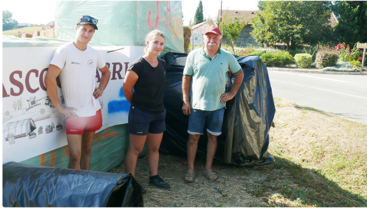
Gascogn'Agri : l'incontournable manifestation agricole proposée par les Jeunes Agriculteurs du Gers

"L'agriculture au cœur des territoires" sera le thème de l'évènement