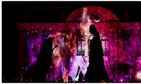
Dionysos écoute les dieux