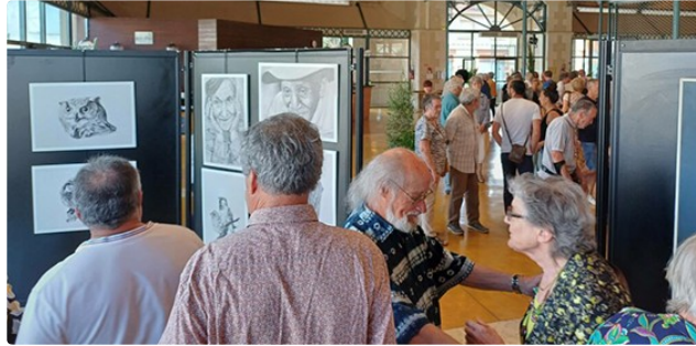
L'été des arts en Gascogne

Peinture, photos, sculptures.. Tout pour ravir l'oeil et l'âme d'amateurs d'art que nous pouvons être. C'est ce que vous propose l'association L'été des Arts en Gascogne du 1er au 6 août avec son exposition annuelle abritée sous la halle mirandaise. Mardi en fin d'après midi avait lieu le vernissage en présence de l'invité d'honneur Thierry Lahontaa. Même si vous êtes un néophyte, allez flaner entre les panneaux et admirer. Si sa peinture devait raconter quelque chose, ce serait une odysée dérisoire, de l'irréel d'un souvenir d'enfance à la réalité crue et compacte du quotidien.