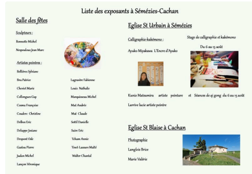
liste artistes 1 jp (2).jpg

Photos : liste des artistes, programme, flyer.