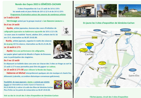
programme ronde des Expos 2023 Séméziez-Cachan (2).jpg