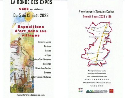
affiche plus flyer et circuit jp (1).jpg