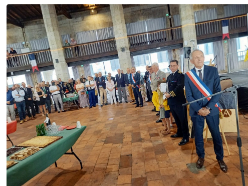
Reconnaissance pour le Mr le Maire d'auch