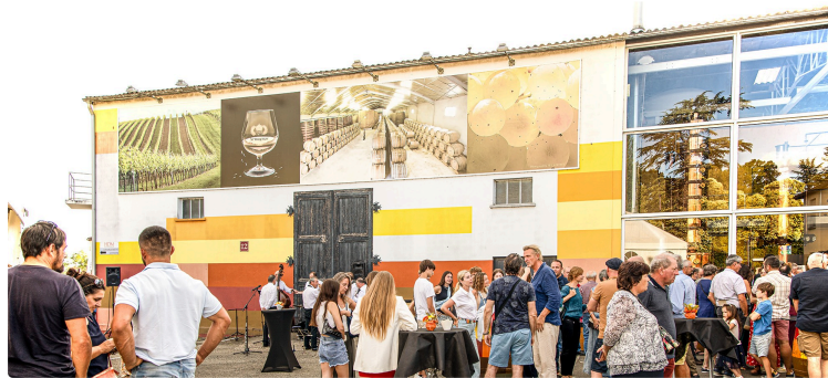
Les 13 et 14 juillet, le 60e anniversaire des Hauts de Montrouge a attiré un large public à Nogaro (I)

Le 13 juillet a été marqué par un spectacle chanté des «Attracteurs étranges»