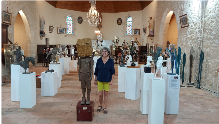
Avoz'art fête ses 10 ans ! Le festival ouvre ses portes samedi prochain !

Le 29 juillet, s'ouvrira le festival de sculpture de Mourède organisé par la sculptrice Béatrice Fernando, un festival qui a acquis ses lettres de noblesse et dont la renommée dépasse aujourd'hui largement les frontières du département.