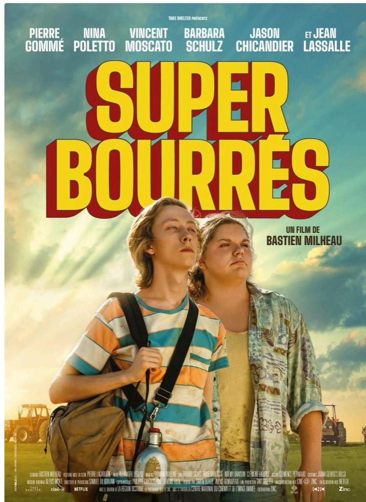
Le film Super- Bourrés pour deux avant- premières à Auch et Condom

Tourné dans les environs de Condom , Super-Bourrés, le premier long-métrage de Bastien Milheau, sortira sur les écrans français le 30 août prochain. Mais deux avant-premières permettront aux Gersois d'avoir la primeur de la découverte sur grand écran :