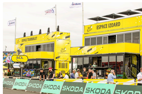
Au bord de la piste

Nous avons été bluffés par le bâtiment du podium qui n'a pas seulement une scène pour la remise des récompenses, mais un écran de télévision géant et la possibilité de faire apparaître une quantité d'autres écrans. À noter qu'une fois le départ de l'étape donné à Dax, l'écran du podium et celui de l'arc de l'arrivée ont permis de suivre les opérations tout au long de la route.