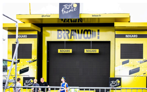
Le bâtiment du podium surgi du néant