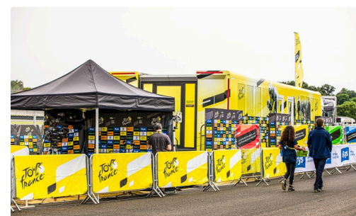
Installations à droite du podium