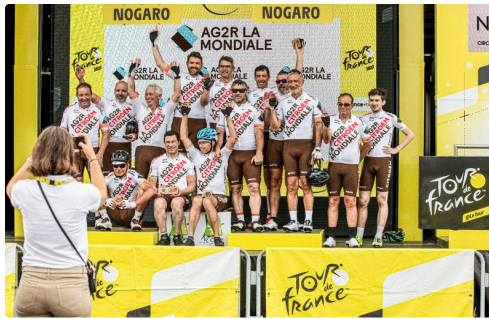
Les cyclos de la Mondiale sur le podium