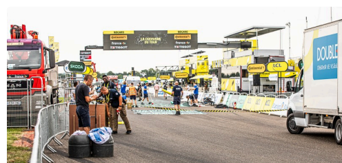
Préparation de la ligne d'arrivée