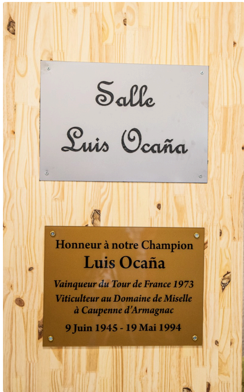
La plaque Luis Ocaña