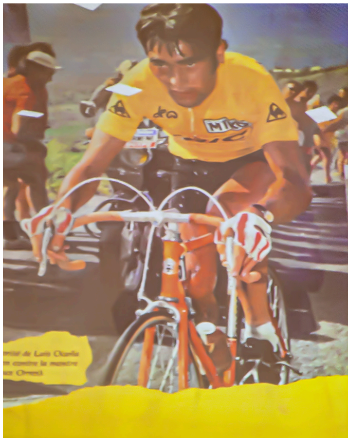
Photo de Luis Ocaña projetée sur l'écran de la salle des fêtes

Aujourd'hui, nous rendons hommage à Luis Ocaña, vainqueur du Tour il y a 50 ans et « qui, tombé sous le charme de la propriété de Miselle, était venu s'installer avec son épouse (...) en 1972 ».